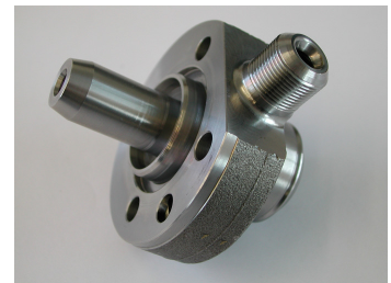
Zylinderkopf für Einspritzpumpe Pumpe-Düse-Motoren

Der Coli-Cleaner reinigt punktgenau zur Konservierung